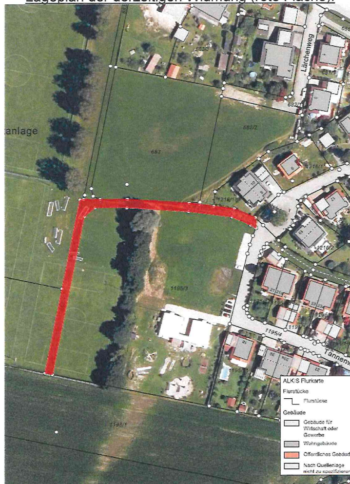
Lageplan der derzeitigen Widmung (rote Fläche):

Der genannte Weg Nr. „(28)“ beginnt „Südöstlich des Grundstückes Fl. Nr. 1195 in Schechen“ und endet mit der „Einmündung in den Tannenweg in Schechen“. Die gewidmete Länge beträgt 191 m.